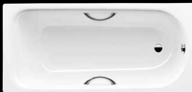
SANIFORM PLUS STAR*